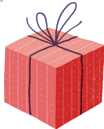
Bild 4 aufhängen

Die Sternexperten waren nicht die einzigen, die sich über die Geburt Jesus freuten: Auch wir freuen uns heute noch. Viele Menschen aus aller Welt feiern gemeinsam, dass Jesus erschienen ist.