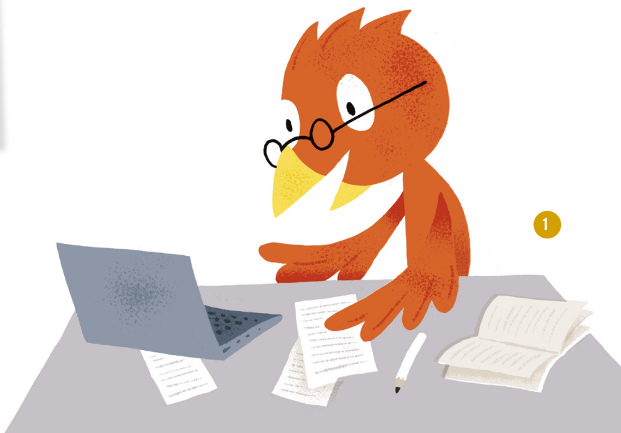
Bild 1 aufhängen

Ich möchte euch heute eine Geschichte von Emso, dem Elefanten, und Pipit, dem kleinen Vogel, erzählen. Diese beiden sind nämlich neugierig und wollten herausfinden, was wir heute feiern. Emso und Pipit sind echt dicke Freunde. Sie verbringen viel Zeit miteinander und sie reisen gerne zu Kindern in verschiedenen Ländern. Auch jetzt an Weihnachten waren sie unterwegs und stellt euch vor: Manche Kinder haben ihnen erzählt, dass sie im Januar die Geburt Jesu feiern. Pipit konnte das nicht glauben. Die Geburt von Jesus feiert man doch an Weihnachten, oder? Pipit wollte der Sache unbedingt auf den Grund gehen. So hat sie Bücher gewälzt, mit verschiedenen Menschen gesprochen und auch im Internet recherchiert.