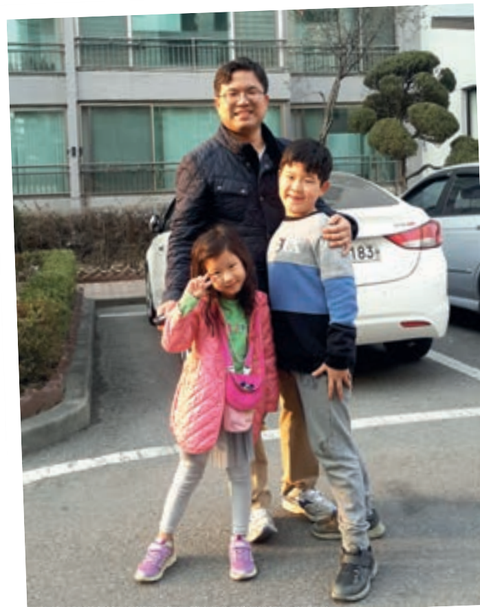
MEIN PAPA, MEINE SCHWESTER UND ICH